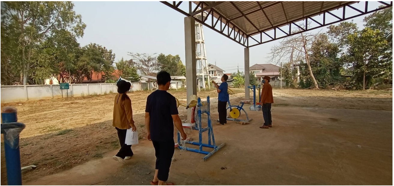
ตัวแทนชุมชนร่วมกับข้าราชการองค์การบริหารส่วนตำบลศรีคำ ตรวจสอบพัสดุงานจ้างก่อสร้าง