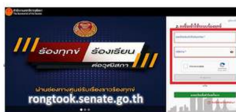
กรอกข้อมูลเข้าสู่ระบบ