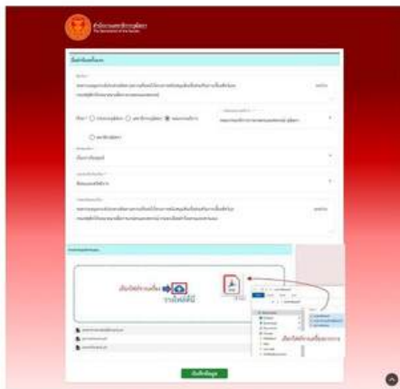
กรอกคำร้องและแนบเอกสารประกอบคำร้อง