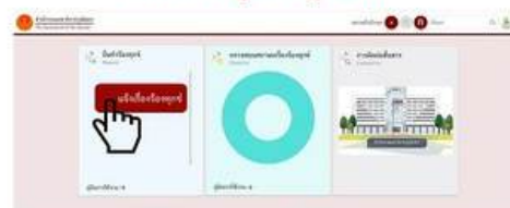
ตรวจสอบสถานะเรื่องร้องทุกข์